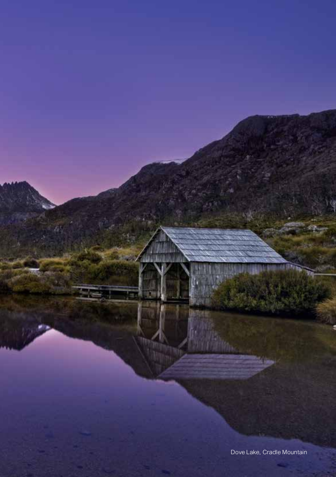
Dove Lake, Cradle Mountain